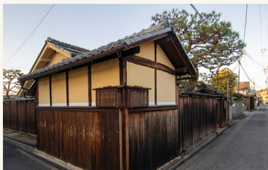
▶旧磯島家住宅に隣接する辻番所

現在、辻番所の会は芹橋二丁目まちづくり懇話会と連携し、歴史的な街並みを保全しながら防災・空家・高齢化・地域の課題に取り組み、魅力ある芹橋を目指して活動しております。